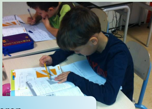
Aandacht voor leren