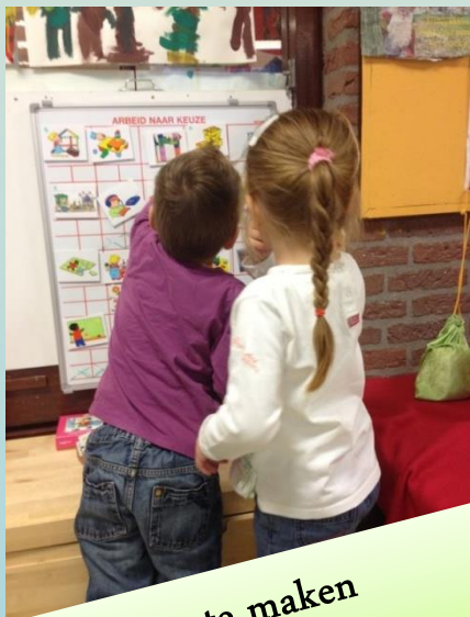
Leren zelf keuzes te maken